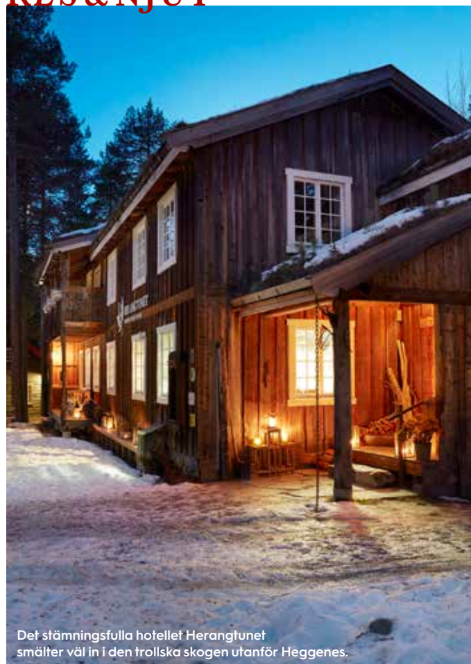
Det stämningsfulla hotellet Herangtunet smälter väl in i den trolska skogen utanför Heggenes.