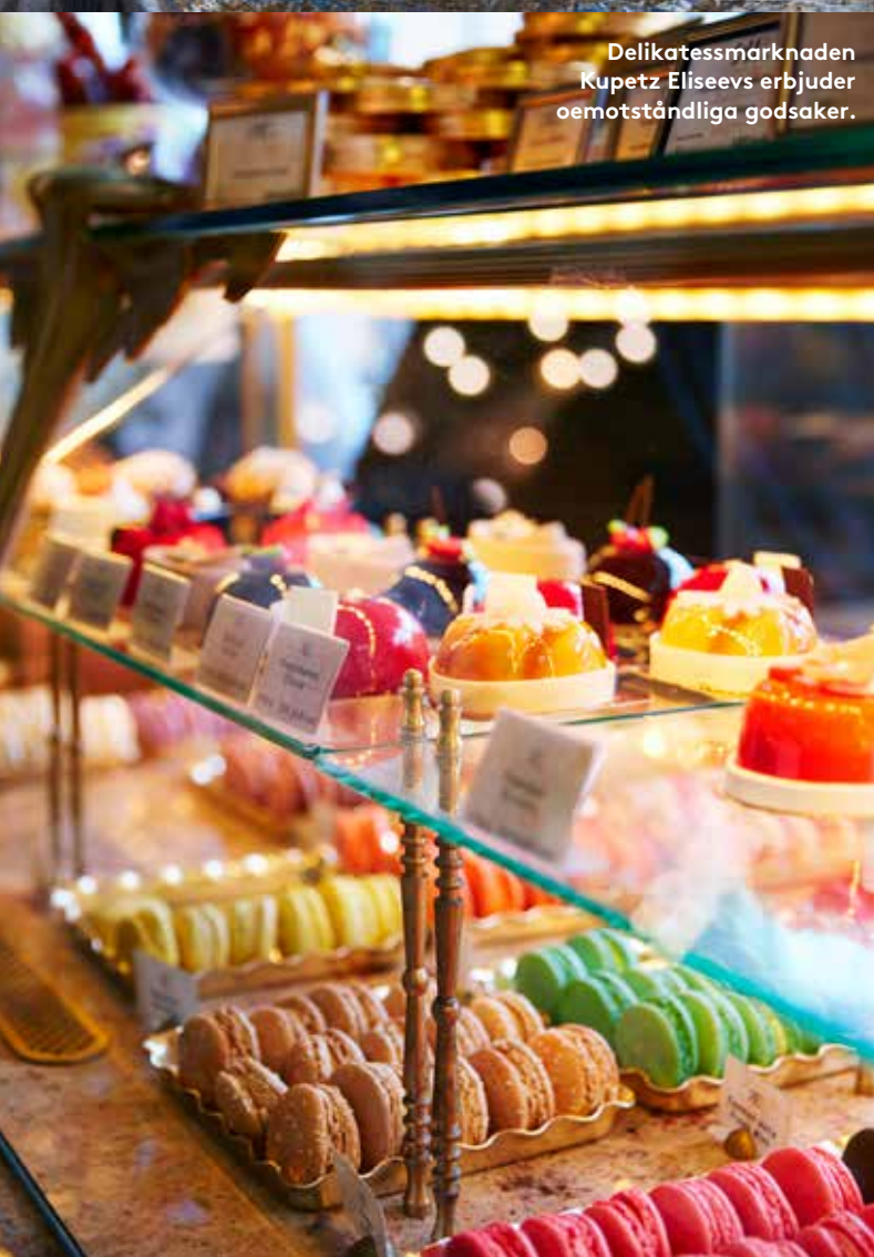
Delikatessmarknaden Kupetz Eliseevs erbjuder oemotståndliga godsaker.