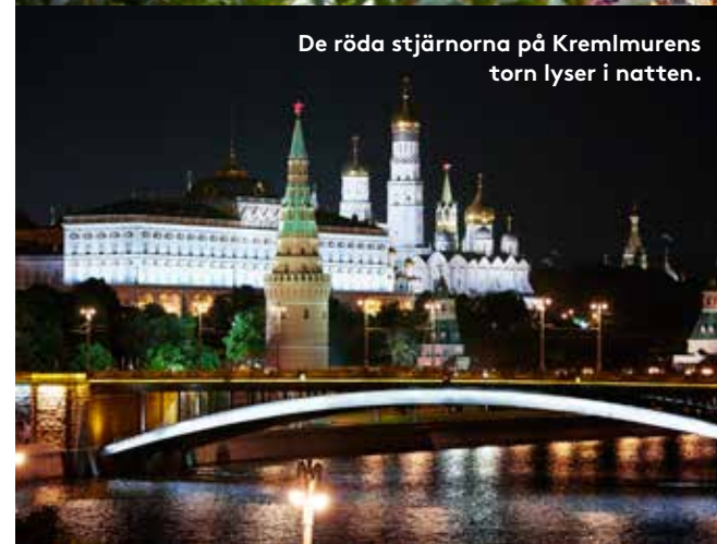
De röda stjärnorna på Kremlmurens torn lyser i natten.