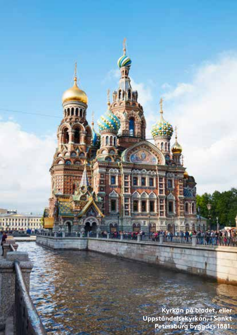
Kyrkan på blodet, eller Uppståndelsekyrkan, i Sankt Petersburg byggdes 1881.