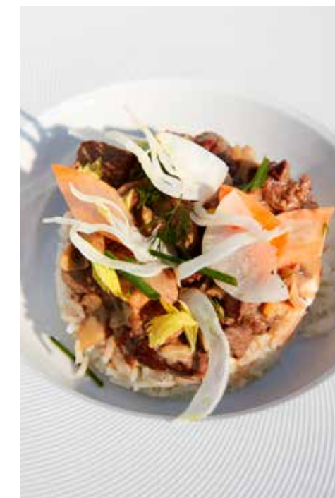
Biff stroganoff i modern tappning serveras på Bellevue Brasserie.

På ön Kizji stoltserar Kristi förklaringskyrka med hela 22 lökkupoler, byggd under Peter den stores tid och erkänd världen över >