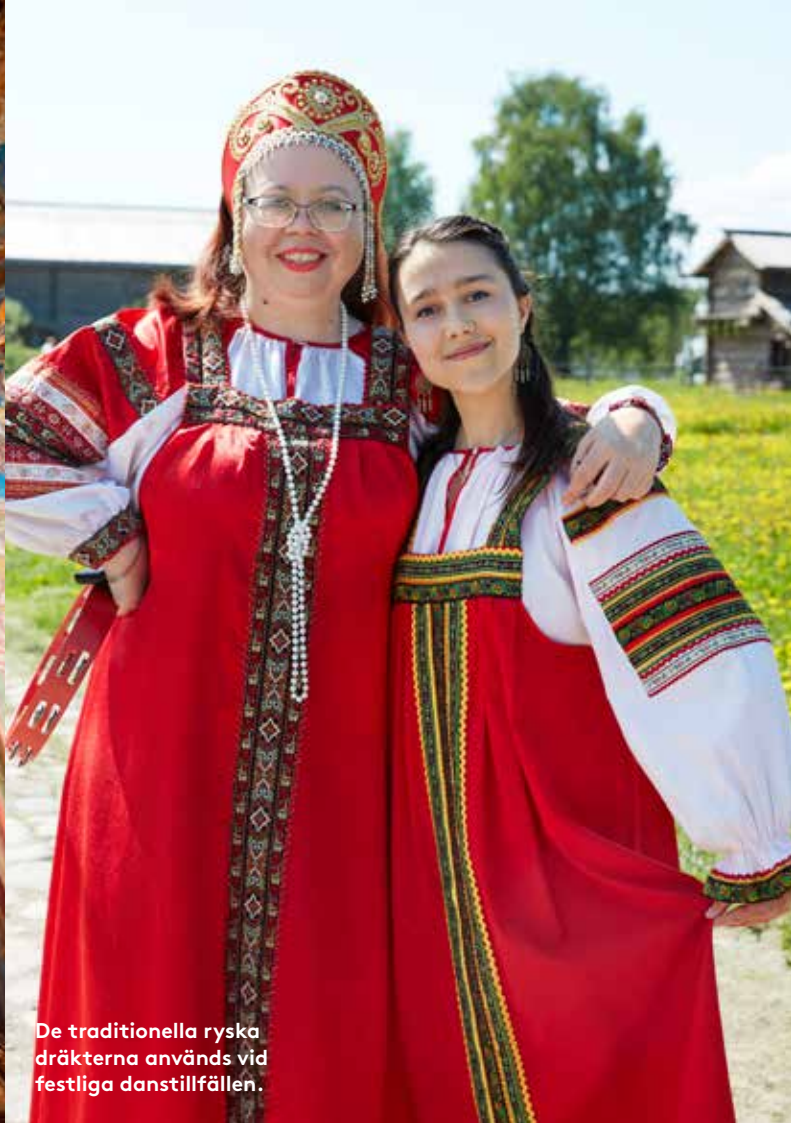
De traditionella ryska dräkterna används vid festliga danstillfällen.