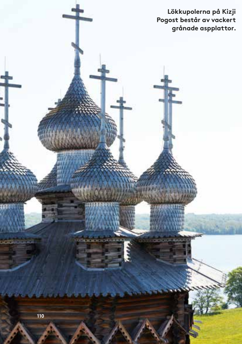
Lökkupolerna på Kizji Pogost består av vackert grånade asplattor.