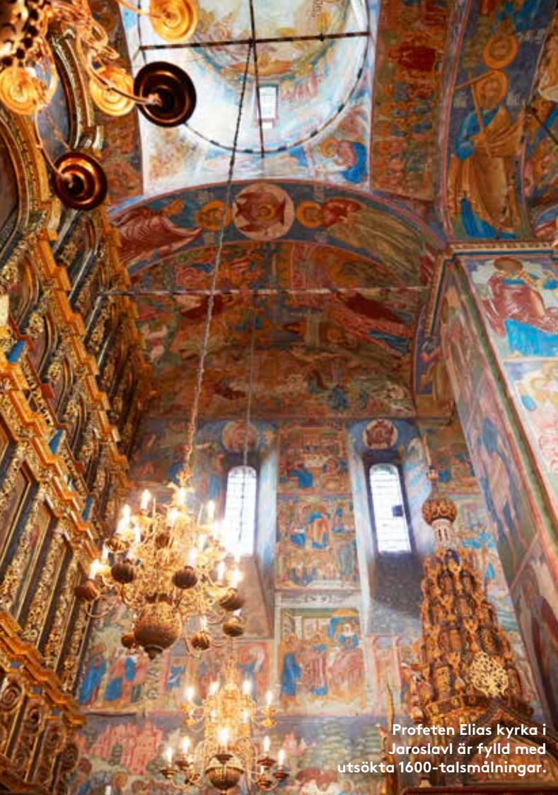
Profeten Elias kyrka i Jaroslavl är fylld med utsökta 1600-talsmålningar.