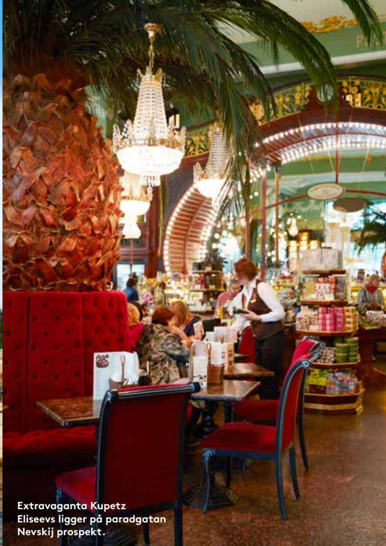
Extravaganta Kupetz Eliseevs ligger på paradgatan Nevskij prospekt.