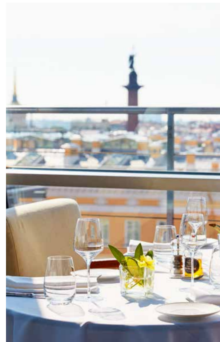
Från Bellevue Brasserie ges en vid vy över Sankt Petersburg.

Katarinapalatsets kyrka med sina skimrande kupoler.