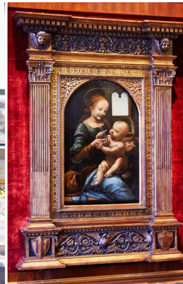
Leonardo da Vincis Madonnan med blomman kan ses på Eremitaget.

På Bellevue Brasseries vackra takterrass i Sankt Petersburg avnjuter jag en modern variant av den klassiska ryska maträtten biff stroganoff. Jag frågar kyparen vilken dryck han rekommenderar till, och får förstas svaret: "Vodka". Då jag precis tillbringat flera timmar på Eremitaget, ett av världens största museer med tre miljoner föremål utställda i 300 salar, känns hans förslag faktiskt helt rätt.