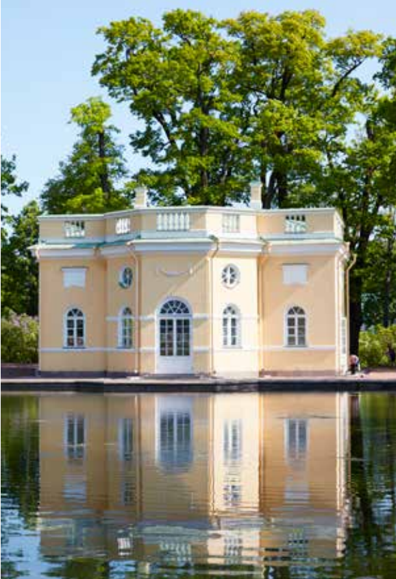
Övre badpaviljongen, byggd på 1770-talet, är en av Katarinapalatsets paviljonger.