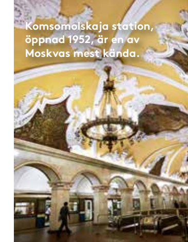
Komsomolskaja station, öppnad 1952, är en av Moskvas mest kända.