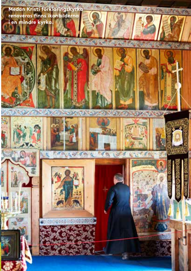
Medan Kristi förklaringskyrka renoveras finns ikonbilderna i en mindre kyrka.